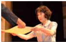
子育て支援会 様 (千々石町)