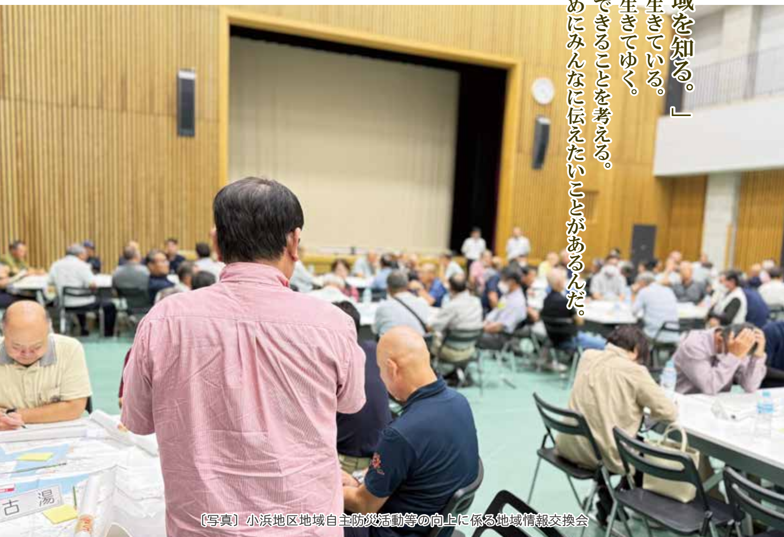
〔写真〕小浜地区地域自主防災活動等の向上に係る地域情報交換会