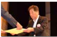
オキチモズクをまもる会 様 (国見町)